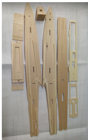
Části gondoly trupu