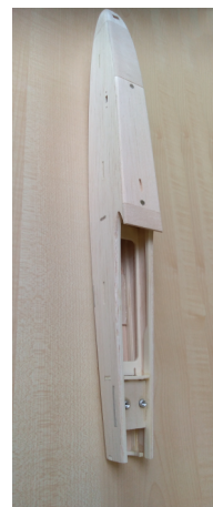
Gondola komplet včetně kabiny již obroušená