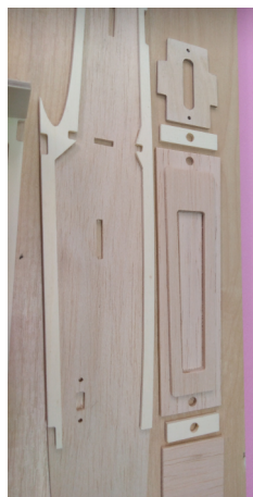
Přilepte překližkové výztuhy a zkompletujte kabinku, magnety uchycení kabiny přilepit před broušením