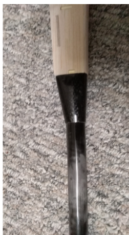
Přechod komplet s gondolou