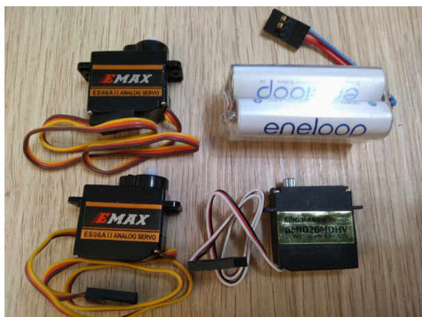
Doporučená elektronika vybavení