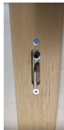
Montáž vlečného háčku