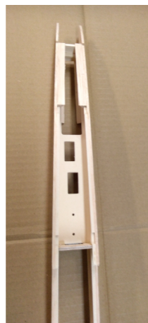
Slepená přední část, přední balsu obrousit do úkosu, nezapomenout zalepit upevňovací matice křídla