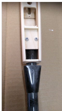
Detail matice křídla M 4. Profil výložníku Vop a Sop s uhlíkovým přechodem. Vše lepit až úplně na konec !!!