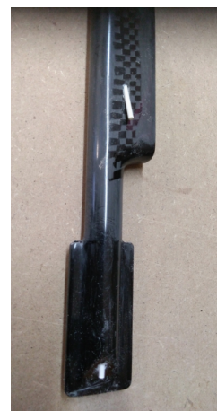
Umístění bowdenů v trupu