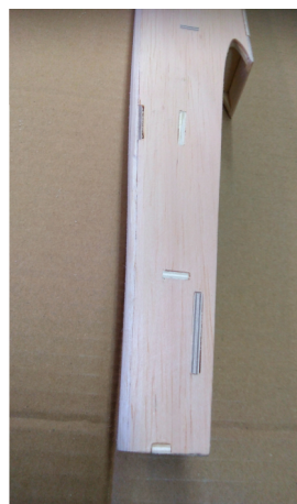
Detail zadní části gondoly