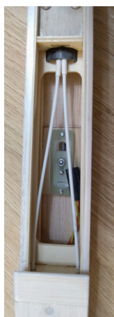
Umístění bowdenů v gondole